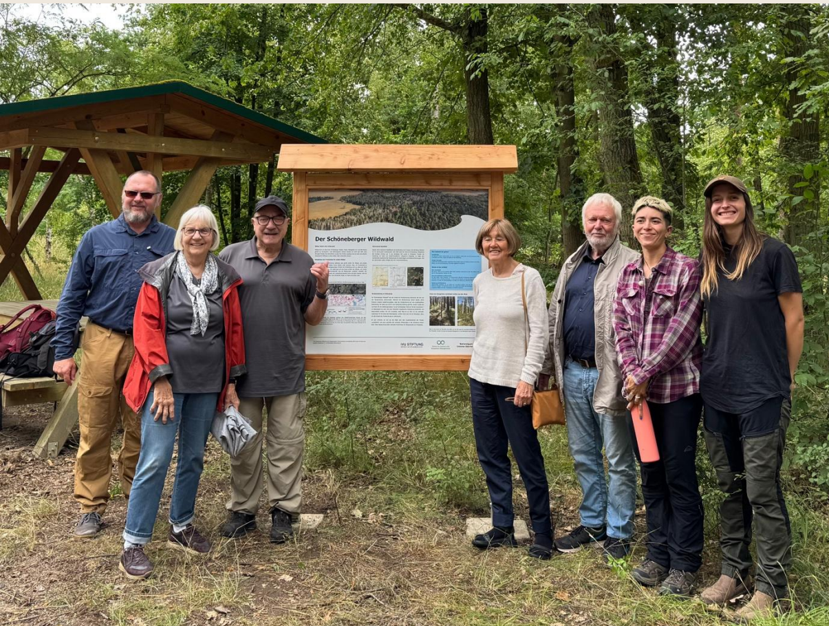
Informationstafel im „Wildwald“ mit Projektteam und den Stifterinnen und Stiftern

Zum Abschluss der Aufbauphase lud das Centre for Eonics and Ecosystem Management e. V. (CEEM) am 10. Juli 2025 zu einem Waldtag in das Besucherzentrum des Nationalparks Unteres Odertal ein. Gemeinsam mit Projektbeteiligten und Gästen wurde der aktuelle Stand vorgestellt und das Waldgebiet besichtigt.