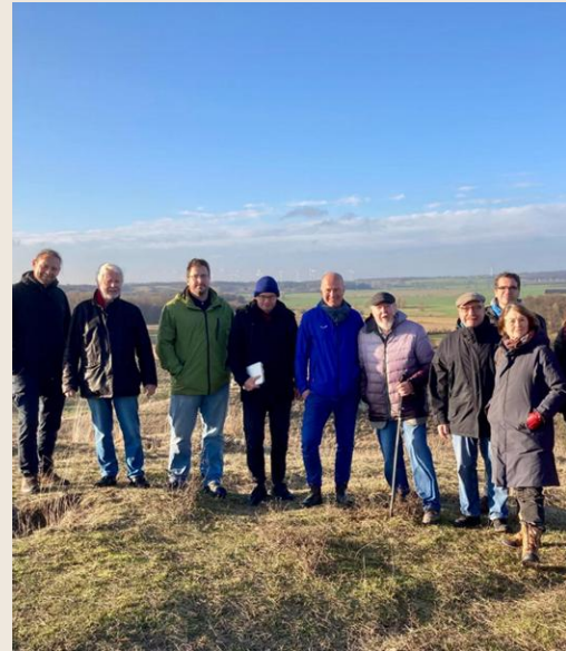
Projektteam Odertalrand mit Prof. Michael Succow (4. von rechts)

Im Mittelpunkt des gemeinschaftlichen Projekts an den Oderbruchtalhängen steht die Frage wie Landschaften unter veränderten klimatischen Bedingungen stabilisiert und gleichzeitig naturnah genutzt werden können.