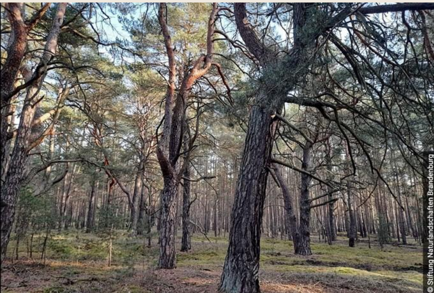
Lage und Bild vom Gebiet Lynow-Heidehof

Auf ehemaligen Truppenübungsplätzen in Brandenburg entstehen großflächige Räume für natürliche Entwicklung. Dort kann sich Natur weitgehend ohne menschliche Eingriffe entfalten.