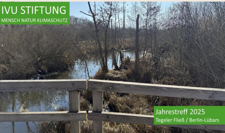
Einladung zum Jahrestreffen in Lübars